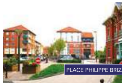
PLACE PHILIPPE BRIZARD