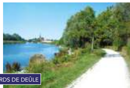
BORDS DE DEÛLE

Au cœur de la métropole lilloise, Saint-André-Lez-Lille bénéficie d'un emplacement stratégique. À proximité de la rocade nord et du boulevard périphérique, la ville est également très bien connectée au territoire par les transports en commun.