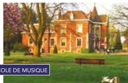
ÉCOLE DE MUSIQUE